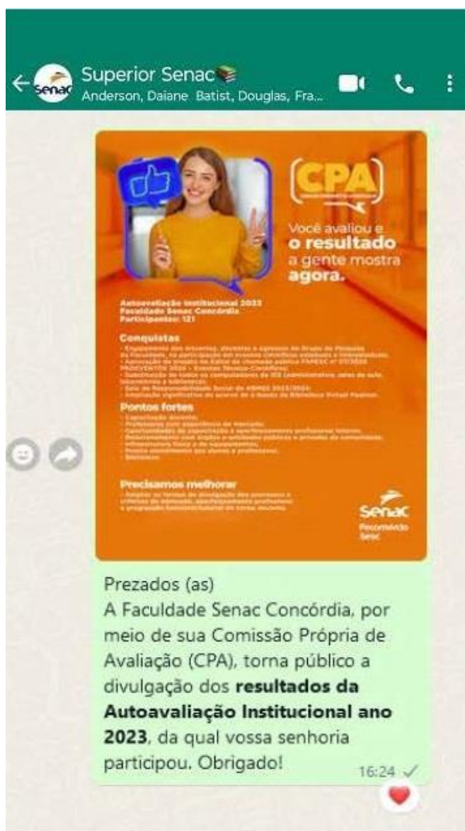
Figura 2 – Forma de divulgação dos resultados obtidos na pesquisa da CPA