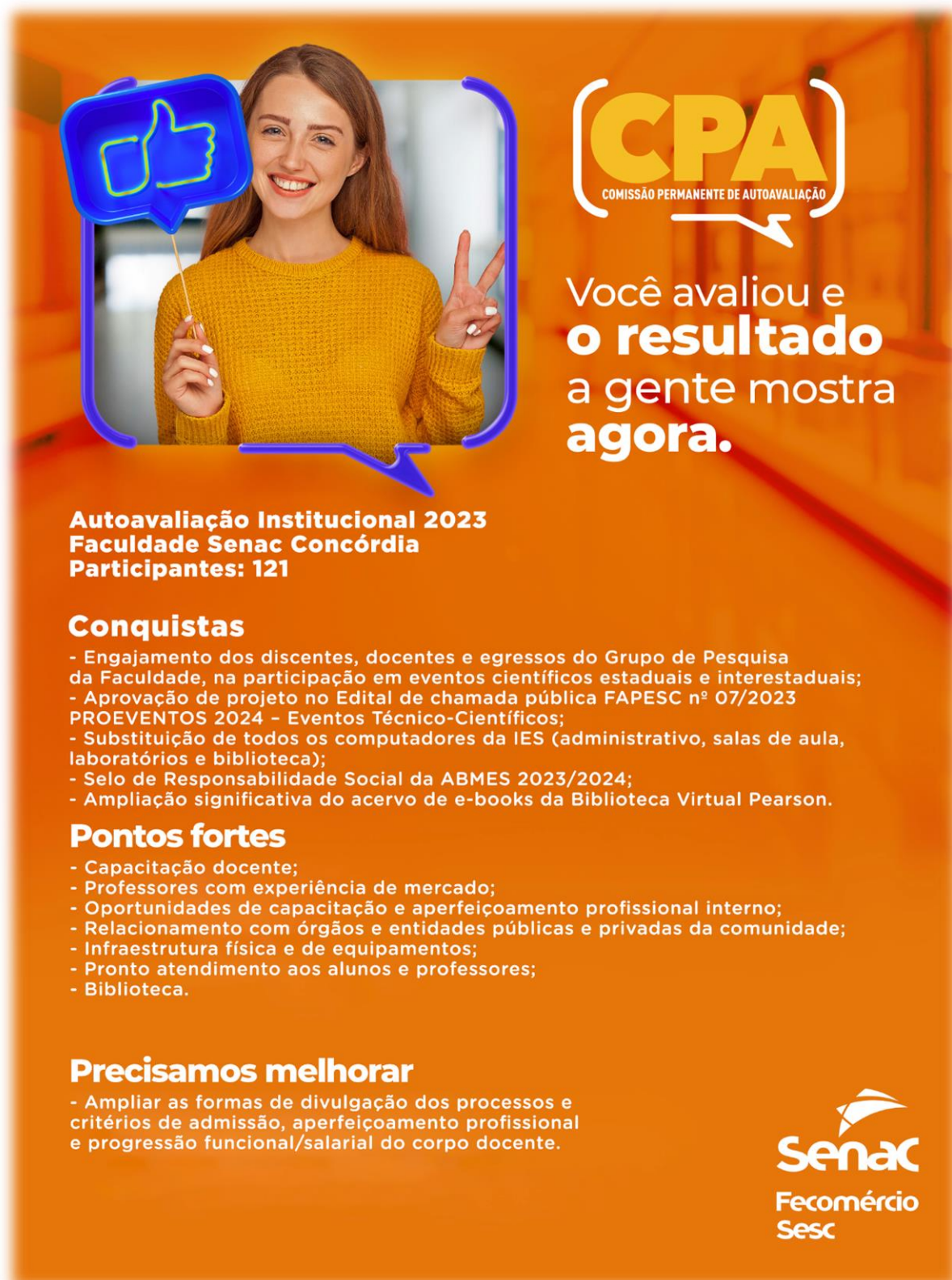
Figura 1 – Forma de divulgação dos resultados obtidos na pesquisa da CPA