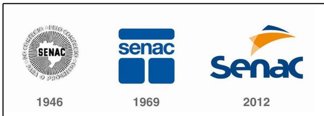
Figura 1: Evolução Marca Senac

Em âmbito nacional, o Serviço Nacional de Aprendizagem Comercial – SENAC, criado pelo Decreto-lei Nº. 8.621/46 em 10 de janeiro de 1946 (BRASIL, 1946), é uma Instituição de Ensino, de Direito Privado, sem fins lucrativos, administrada pela Confederação Nacional do Comércio e que oferece serviços de educação profissional em todo território nacional. A instituição tem marcante atuação em todas as Unidades da Federação, reconhecida pela sua competência na oferta da Educação Profissional. A credibilidade de sua marca está pautada na vinculação entre educação profissional e trabalho, aliando teoria e prática de forma interativa em uma gestão por resultados, com flexibilidade e autonomia, garantindo uma ação institucional criativa, audaciosa e em constante crescimento e aperfeiçoamento.