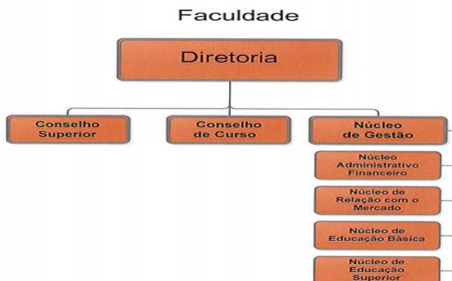
Figura 1. Organograma da Faculdade Senac Palhoça