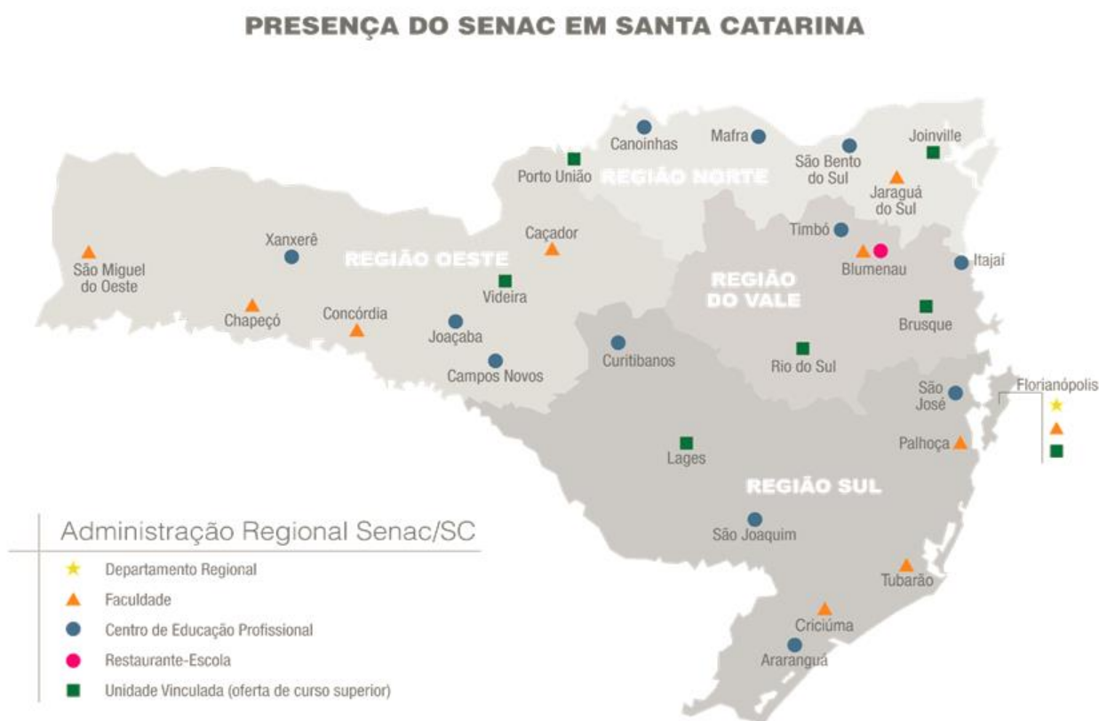
Figura 4: Área geográfica de atuação do Senac/SC, 2017

Devido à grande inserção em Santa Catarina, as Unidades Educacionais do Senac estão divididas em regiões, assim dispostas: Região Oeste, Região Sul e Região Norte-Vale, conforme mapa a seguir: