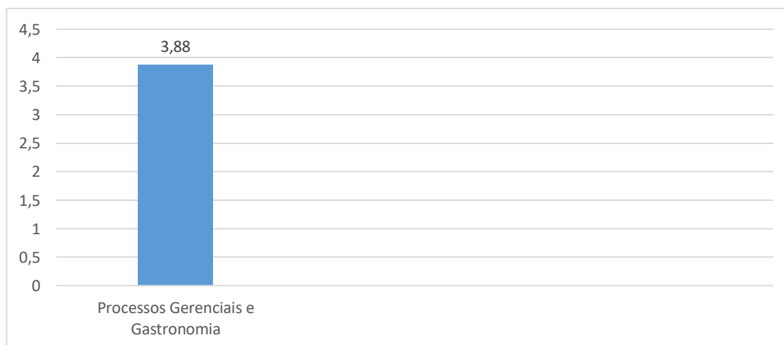
Gráfico 4 – Avaliação dos egressos

No gráfico 4, apresenta-se os resultados gerais da avaliação dos egressos.