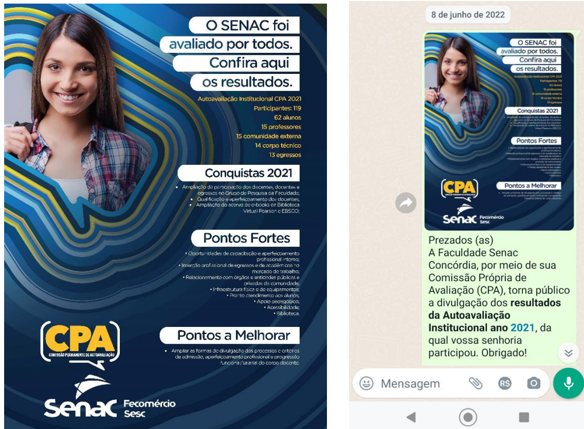
Figura 1 – Forma de divulgação dos resultados obtidos na pesquisa da CPA

Para divulgação dos resultados foram fixados cartazes em todas as salas de aula, sala dos professores, cantina, biblioteca e laboratórios. Nos cartazes e no banner constam os resultados obtidos na pesquisa de autoavaliação destacando as conquistas, pontos fortes e os pontos a melhorar.