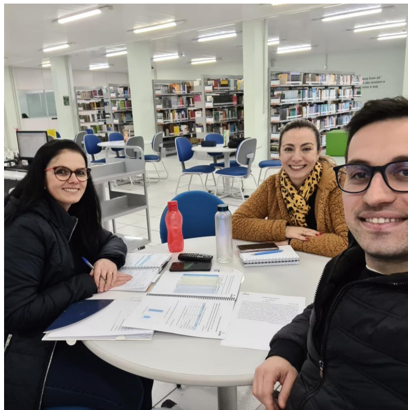
Foto 2 – Realização de grupo focal para análise dos dados obtidos na pesquisa