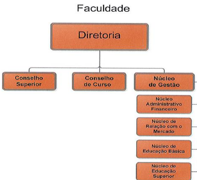
Figura 1. Organograma da Faculdade Senac Criciúma