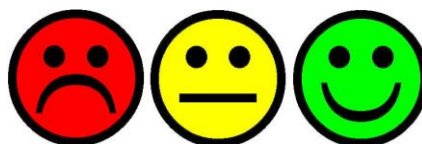
Figura 2 - Emotion

A cor Verde sinaliza que os indicadores avaliados estão com elevado conceito ( emotion sorrindo), dispensando qualquer ação corretiva sobre os mesmos. A cor Amarela sinaliza que os indicadores precisam de atenção e monitoramento ( emotion indiferente) para que não se torne uma fragilidade. A cor Vermelha sinaliza que o indicador necessita não apenas de uma atenção mais acurada ( emotion zangado), mas também de uma intervenção imediata no sentido de mitigar a fragilidade que o indicador sinaliza, conforme figura abaixo.