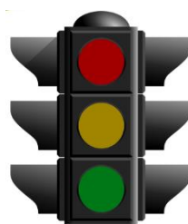
Figura 1 - Semáforo