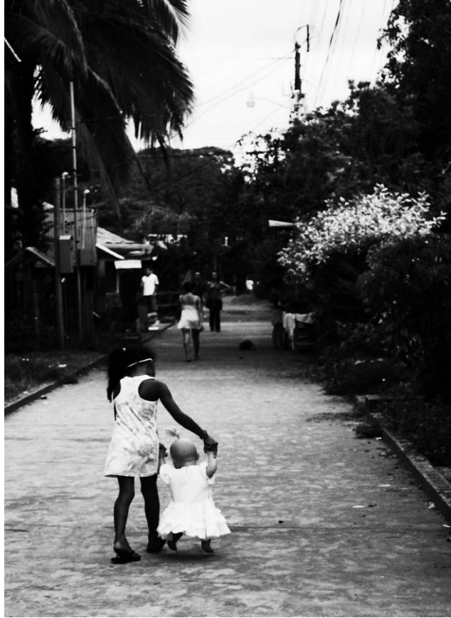
Figura 16 - Para ver – “Entonces jugar!” Série “Aqueles que Caminham”, Tortuguero, Costa Rica. Fotografia digital, 2009.