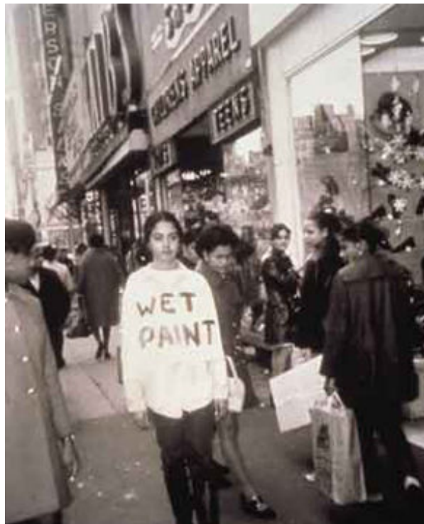
Figura 5 - Adrian Piper, "Catalysis III," 1970.

Dan Graham, artista americano, utilizava-se de circuitos de câmara colocando o observador em posição de auto-reflexão a partir da reprodução da sua própria imagem. Interessado nas ligações do espaço arquitetônico e seu tratamento como fenômeno do minimalismo, Graham integra na sua obra percepção, distancia, observação, direção e presença.