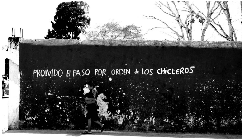
Figura 10 - Infra-ação – “Estoy a camino de casa.” Série Aqueles que Caminham, Valladolid YUC, México. Fotografia digital, 2009.