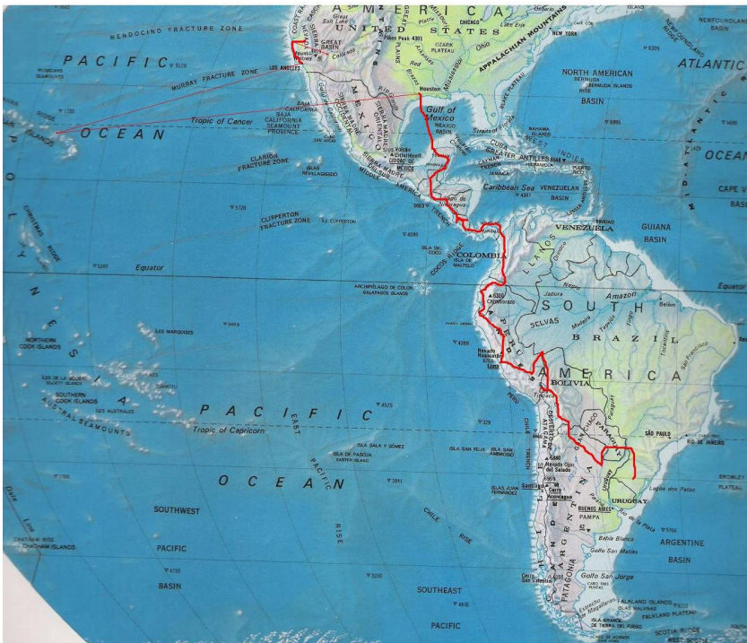
Figura 23 – América Mapa da viagem, 2008 à 2009

Se caminhamos, para esse jogo da vida de infinitas possibilidades, deveríamos entender algumas finalidades, como artista, fui treinada nas habilidades e faculdades da sensibilidade, descubro que “Aqueles que Caminham”, estará em eterno processo.