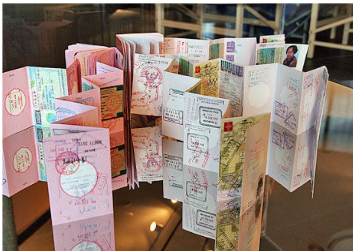
Figura 1 – Rirkrit Tiravanija, Unfitted (passport no. 3). 2006