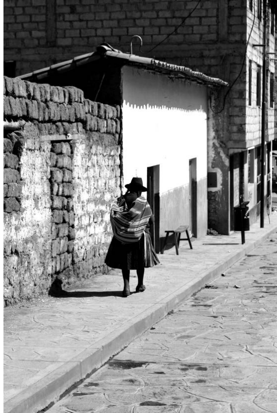
Figura 20 – Dias de Inti Rayme – “Mirar la fiesta del sol.” Série “Aqueles que Caminham”, Cusco, Peru. Fotografia digital, 2009.