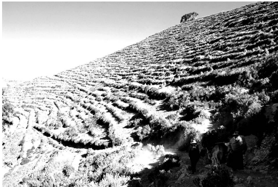
Figura 21 - Ora numa ilha ora noutro mundo – “Continuar em la isla.” Série “Aqueles que Caminham”, Isla del sol, Titicaca, Bolívia. Fotografia digital, 2009.