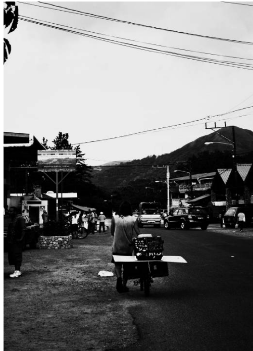
Figura 17 – Ser o que quiser – “Encontrarme en cada lugar.” Série “Aqueles que Caminham”, Valle d'Anton, Panamá. Fotografia digital, 2009.