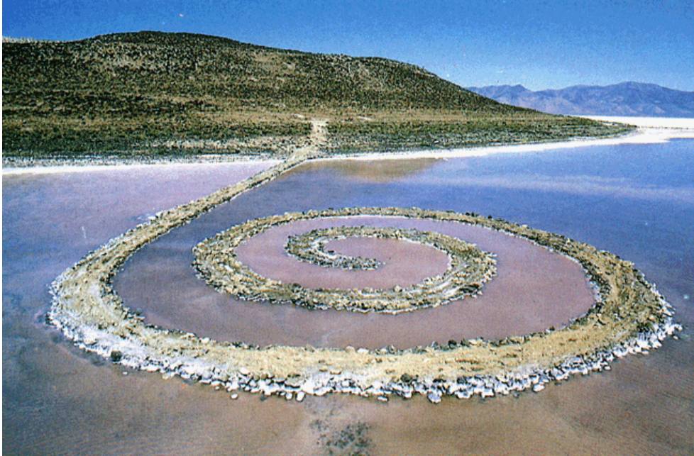
Figura 3 - Smithson, Robert, Spiral Jetty, 1970.