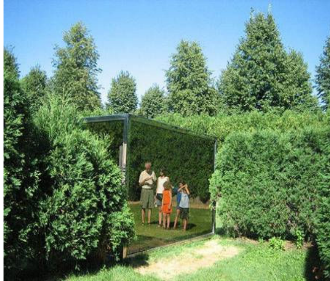
Figura 6 - Dan Graham, two-way mirror labyrinth, 1989. Fonte:

www.architecture.blogger.com.br/ em 19/08/2009.