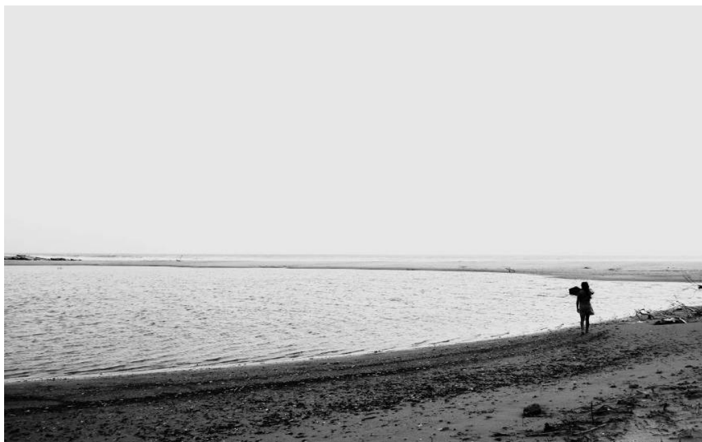
Figura 15 - Cuento de hadas –“Meu conto de fadas!” Série “Aqueles que Caminham”, Popoyo, Nicaragua. Fotografia digital, 2009.