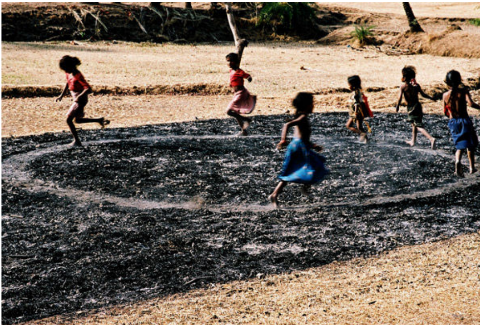
Figura 4 - Long, Richard, " Walking and Running Circle, 2003. Fonte:

Fonte: http://www.hawaii.edu/lruby/art400/SPIRALJ.GIF em 17/08/2009.