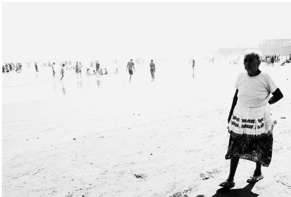
Figura 13 - Diante de quem não viu –“Encontrar a uma persona.” Série “Aqueles que Caminham”, El Cuco, El Salvador. Fotografia digital, 2009.