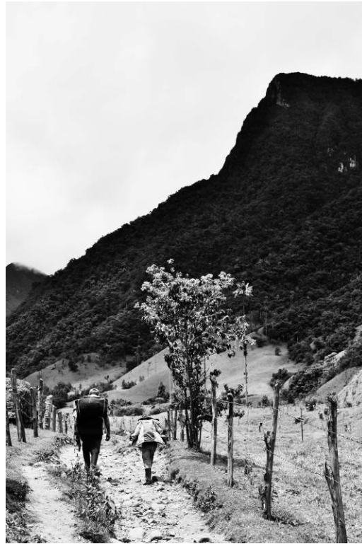
Figura 18 - Doces rutas –“A mi neto, mostrar la conexión con la naturaleza.” Série “Aqueles que Caminham”, Valle de Cocora, Colômbia. Fotografia digital, 2009.