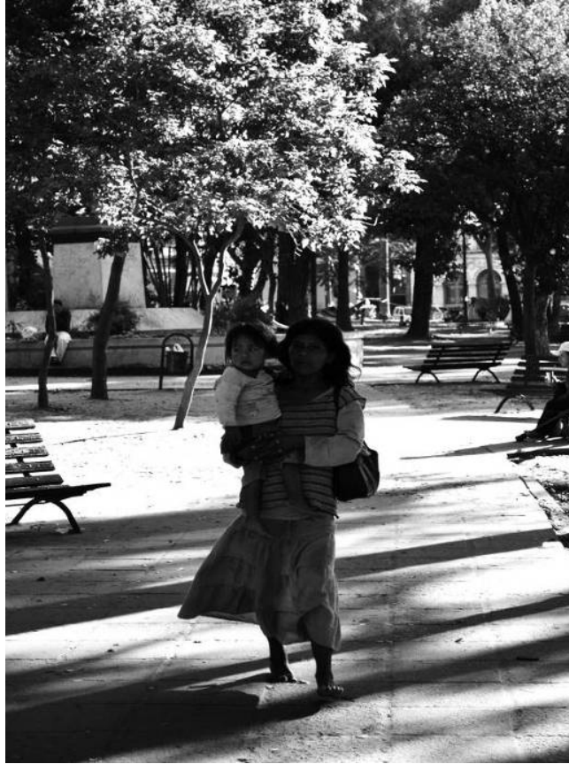
Figura 22 - Quase lá – “ Los derechos de uma raza.” Série “Aqueles que Caminham”, Asunción, Paraguai. Fotografia digital, 2009.