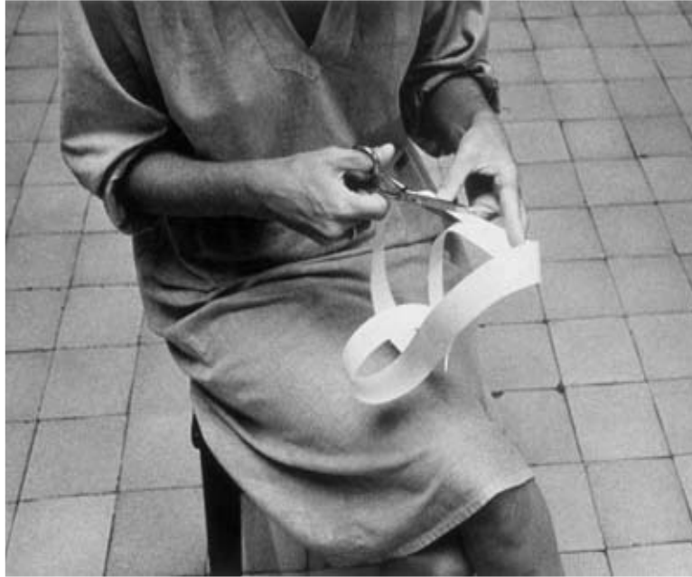
Figura 8 - Lygia Clark, Caminhando, 1963.