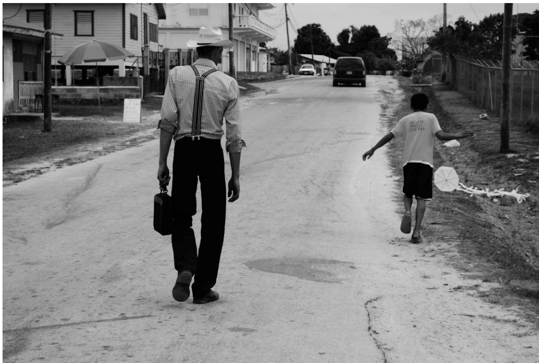
Figura 11 - Ustedes hacen amor? – “I want to be happy with my wife and my kids.” Série “Aqueles que Caminham”, Orange Walk, Belize. Fotografia digital, 2009.