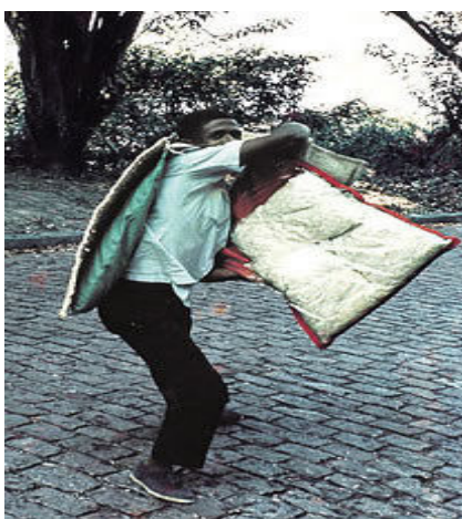
Figura 2 - Helio Oiticica, Parangolé, 1964.

Partindo desse ponto, da ação de pensar o que é arte e o que não é, ou que tudo pode ser arte, Oiticica (1964) coloca essa participação do expectador de ordem material, como sendo o espectador uma parte que completa fisicamente a obra.