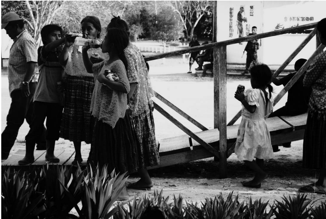
Figura 12 - Conta a mina ação –“Respectada por lo que soy.” Série “Aqueles que Caminham”, Tikal, Guatemala. Fotografia digital, 2009.