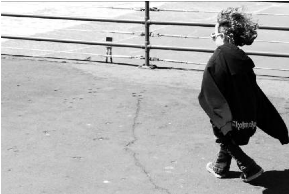
Figura 9 - Ouvindo o vento passar – “I want to fly!” Série Aqueles que Caminham, Santa Mônica CA, Estados Unidos Fotografia digital, 2009.

Revelando a persistência da espécie em ser um testemunho inconsciente e passivo da vida que transcorre, as imagens mostram a interferência humana da existência mecanizada, nesse horizonte imaginário subjetivo que são os momentos, o registro é como uma anamnese do tempo.