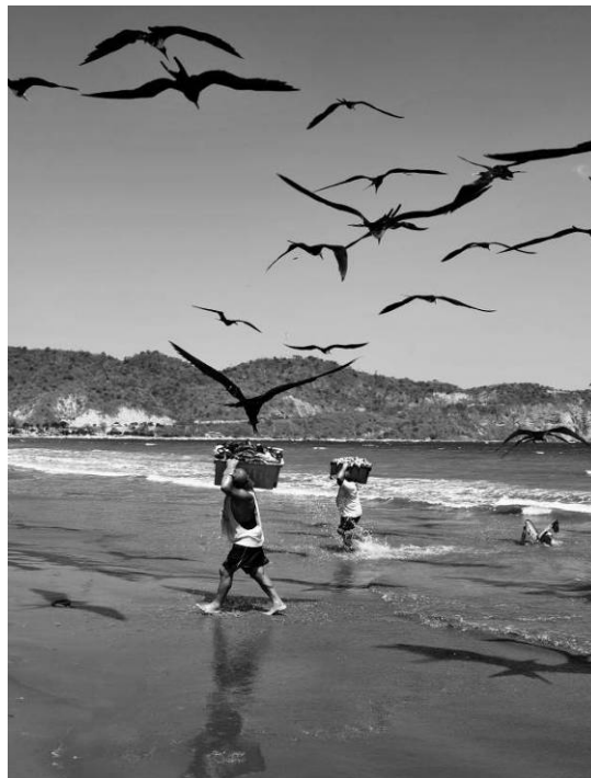
Figura 19 - Pescador de sonhos roubados –“ Llegar en casa.” Série “Aqueles que Caminham”, Puerto López, Equador. Fotografia digital, 2009.