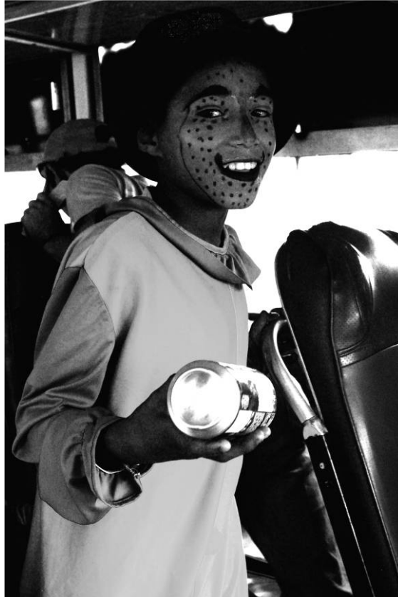
Figura 14 - Fabulosos jogos do caminho –“ Vivir feliz com mi hermano y hacer sonreír a la gente!” Série “Aqueles que Caminham”, San Lorenzo, Honduras. Fotografia digital, 2009.