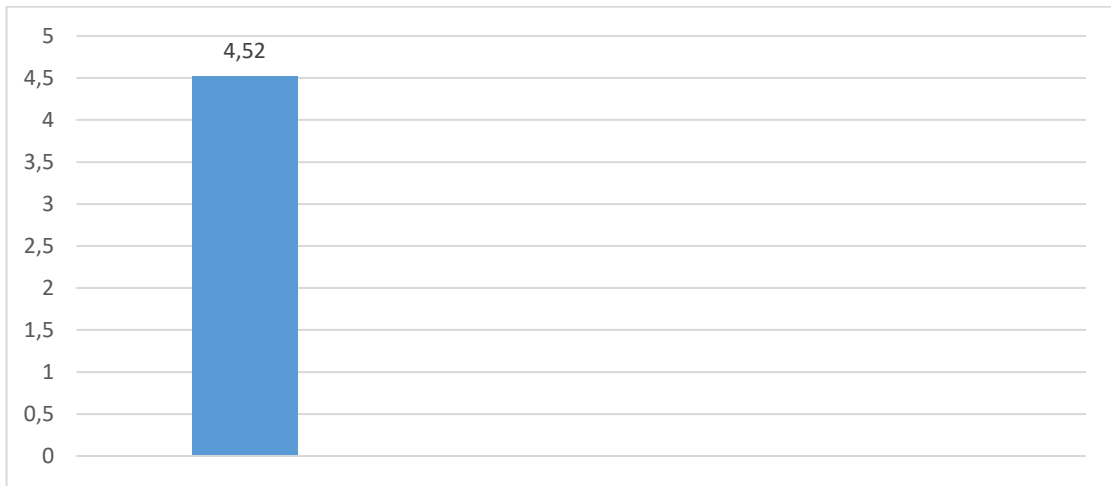
Gráfico 3 – Avaliação dos Técnicos Administrativos

No gráfico 3, apresenta-se o resultado da pesquisa com os respondentes do corpo técnico-administrativo.