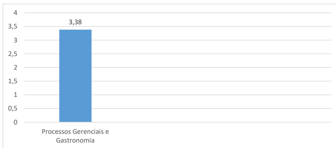
Gráfico 4 – Avaliação dos egressos

No gráfico 4, apresenta-se os resultados gerais da avaliação dos egressos.