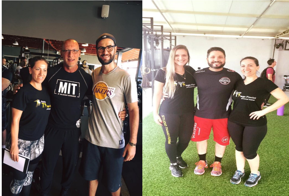
Figura 01 – Curso de Aperfeiçoamento

cursos voltados para a área de atuação da empresa. A figura abaixo demonstra alguns desses cursos.