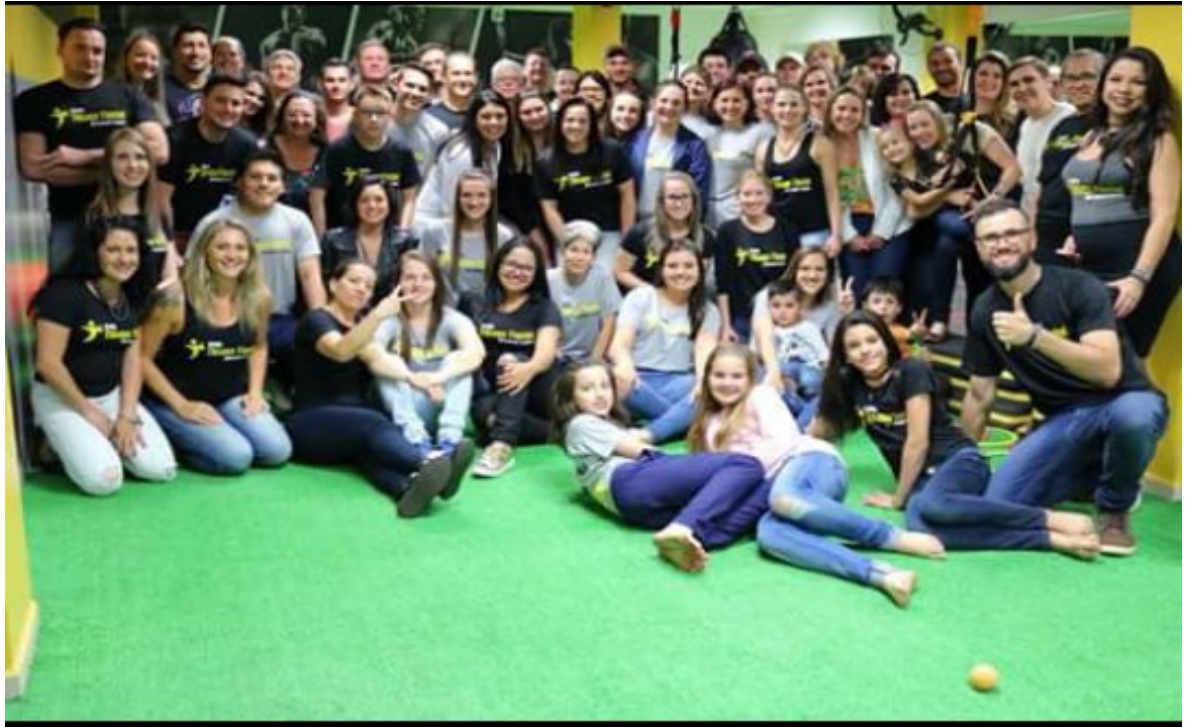
Figura 02 – Confraternização de final de ano

ambiente da academia, algo diferente do que encontramos no mercado em que a empresa está inserida, como podemos observar nas fotos abaixo.