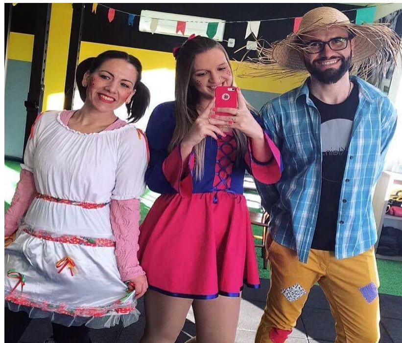
Figura 03 – Festa Junina