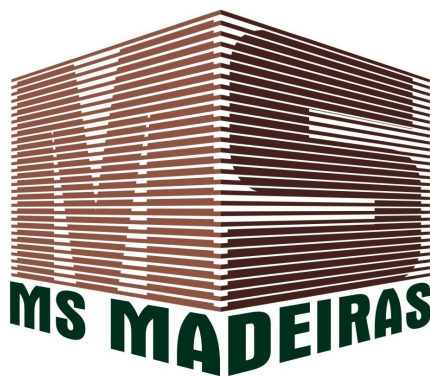
Figura 3: Marca da empresa - MS Madeiras

A diagramação do nome da empresa também é representada em perspectiva, seguindo o sentido da parte superior para que tenha unidade na marca.